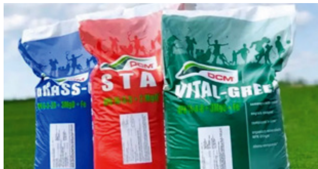
DCM Düngersortiment für eine optimale Nährstoffversorgung das ganze Jahr über