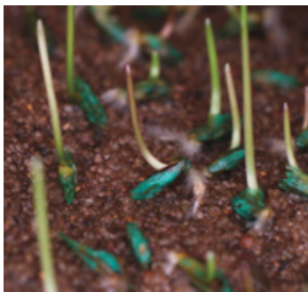
Saatgut mit ProNitro, 3 Tage nach der Aussaat

Jetzt ist die richtige Zeit, um den Rasen optimal auf die Gartensaison vorzubereiten! Mit der richtigen Pflege im Frühjahr wird ein guter Wachstumsstart sichergestellt und der Grundstein für ein sattes Grün bis in den Herbst hinein gelegt!