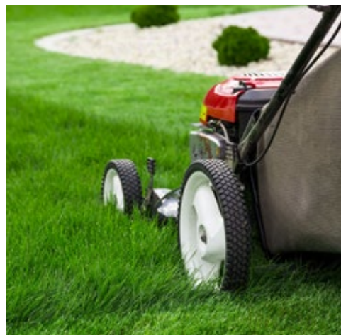
Ein gepflegter Betriebsstandort ist die Visitenkarte jedes Unternehmens!

Für jedes Unternehmen ist der Eindruck auf den Kunden wichtig – dazu gehört auch ein perfekt gepflegtes Erscheinungsbild sämtlicher Grünareale samt Parkflächen.