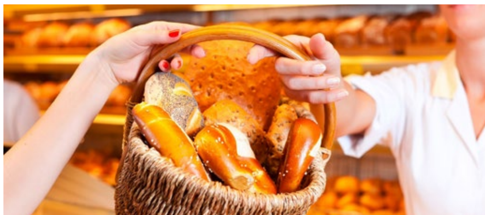
Bei der Bäckerei Schwinn gibt's jede Woche verschiedene Angebote an köstlichem Brot und Gebäck!

Dem traditionsreichen Handwerksbetrieb, der Bäckerei Schwinn, ist diese Tatsache bewusst und deshalb hat man sich hier auf die Fahnen geschrieben, dass Gutes nicht